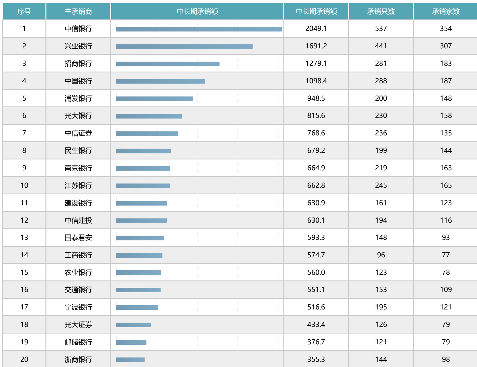
表1：中长期承销情况统计