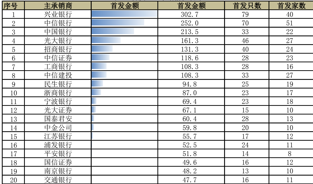
表 3 首发企业承销情况统计