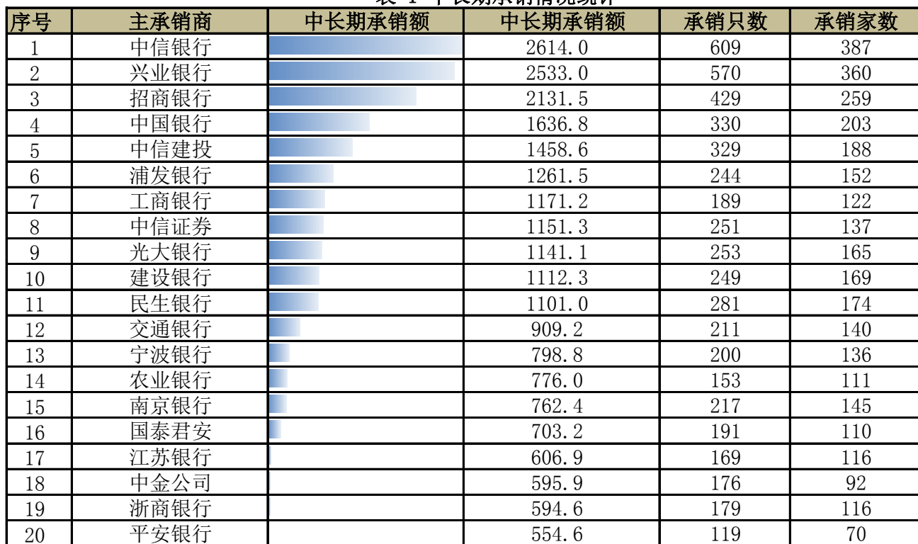
表 1 中长期承销情况统计